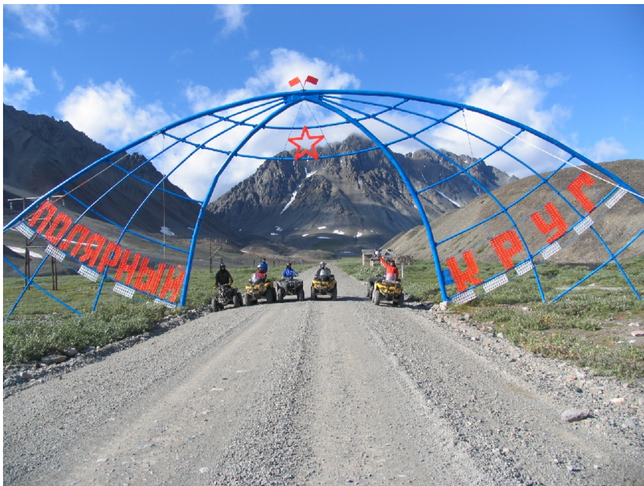
Экспериментальный раздел. (Эгвекиот – Певек).

В ходе ознакомительной поездки и выяснилось, что техника не вся в порядке, но остановить нас это не могло. После музея, ужина и ночевки в шикарных коттеджах, в отдельных спальнях, на двухспальных кроватях – дождливое утро, сборы и старт. Даешь Певек!